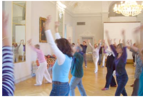
„Sigmaringen in Bewegung“