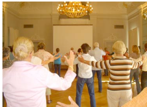
rege Publikumsbeteiligung am Qi-Gong