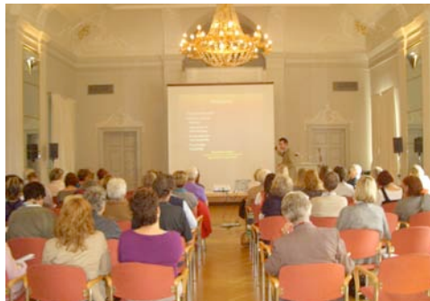
Zuhörer im Hofgarten